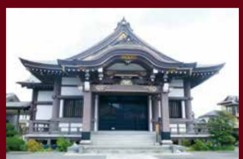
▲楽しい催しが盛りだくさんの法伝寺

法伝寺 ス 伝統工芸と昔遊びで懐かしのひとときを ◆伝統工芸展示・昔遊び体験・駄菓子販売 日22日(土)・23日(日)午前10時~午後4時 ◆おはなし会 日22日(土)・23日(日)午前10時30分~正午 ◆南行徳の民謡のついで 日22日(土)午後1時30分~2時30分 ◆お茶席 日23日(日)午前10時~午後4時 ¥1席300円