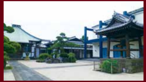
▲音楽と笑い声が境内に響き渡ります

善照寺 ス お寺で落語とコンサート 先着100人 ◆古今亭菊之丞独演会 日22日(土)午後1時30分~3時 ◆お寺でクラシックコンサート 日23日(日)午後1時~1時45分 ◆マンドリンとギターのアンサンブル 日23日(日)午後2時~2時45分