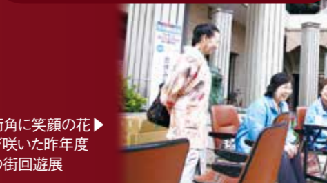
街角に笑顔の花が咲いた昨年度の街回遊展