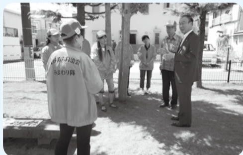
▲山王公園で曾谷第6自治会員にお話しを伺う市長

隊市川募集案内所 (危機管理課) 18日(土) 320-3973 清掃事業課 受付期間 11月1日(金)～平成26年1月10日(金) 一次試験 平成26年1月18日(土) 320-3973 清掃事業課