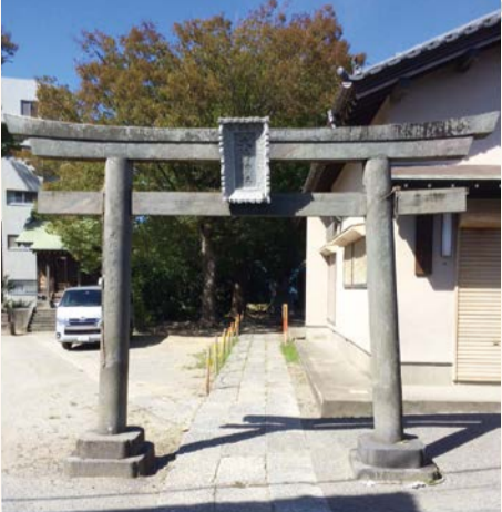
▲大鷲神社の鳥居 柱に文化7(1810)年と刻まれている

しかし近年、江戸川放水路の開削をはじめ、京葉道路、東西線、湾岸道路、京葉線、そして今年開通した外環道路が高谷周辺を縦横に走るようになりました。同時に、斬新なデザインの建築や若い人向けのマンションの建設が進み、高谷周辺の景観は大きく変わりつつあります。 それでも、二丁目の旧市街地には依然として味のある木造建築の旧家が点在し、屋根にはそれぞれ家紋や家名の入った鬼瓦が見られます。屋根の向こうにはこんもりとした大鷲神社の鎮守の森ものぞいています。安養寺には、はだしでお参りする「準四国八十八カ所霊場」をはじめ「仏足跡」「筆塚」「寝釈迦」「布袋尊像」など、多くの見所があります。鬼瓦を見上げながら歩いて行くと、曲がりくねった道に方向を失ったり、行き止まりに迷い込んだりしますが、それも歴史のある街を歩く面白さです。高谷の旧市街地は今も浮島の面影を残す魅力のある街です。(広報広聴課)