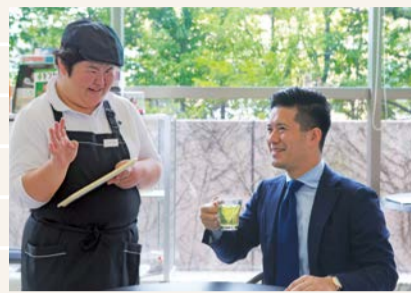
▲カフェテラスぴっころ(メディアパーク市川内)にて

障がいの有無に関わらず、スポーツや芸術を皆で楽しみ、職場や地域活動で共に働く。障がいのある人も決して特別な存在ではありません。また一概に「障がい者」といってもその状況はさまざまですが、近年では、内部障がいなど見た