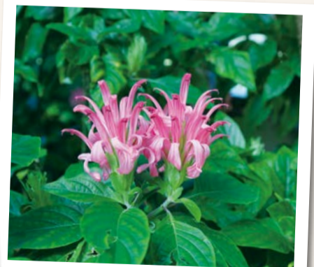
冬でも色鮮やかな花が観賞できます