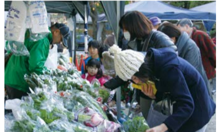
▲新鮮な野菜がいっぱい(昨年の様子)

農水産まつり 市川産の新鮮な農水産物の販売やエコポ満点カードとシクラメンの交換などを行います。 日 12月15日(土)午前11時~午後2時(完売次第終了、荒天中止) 場 JAいちかわ行徳支店駐車場(湊新田1-6-2)、車での上場不可 問 ☎711-1141農政課