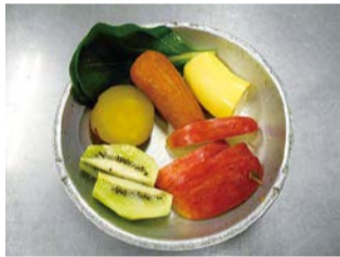
▲何の動物のエサかな

普段は入れない調理室に案内します。飼育員が動物たちのエサについて詳しく話します。 日 12月16日(日)午後2時(動植物園管理棟入口集合) 場 動植物園 人 当日先着20人程度 料 入園料のみ(高校生以上430円、小中学生100円) 問 ☎338-1960同園