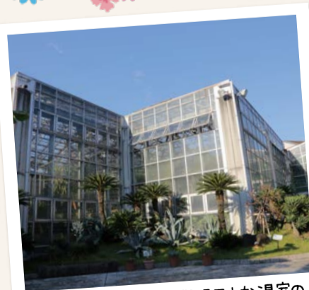
観賞植物園内にそびえる巨大な温室のなかにはめずらしい熱帯植物がたくさん