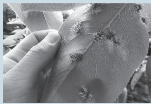
▲赤星病の被害に遭った梨の葉

梨が赤星病に感染すると、葉が落ちたり果実が奇型になったりして収穫量が減少します。この赤星病は、びゃくしん類(※)の樹木が菌を媒介するため、「市川市なし赤星病防止条例」により、下記の区域ではびゃくしん類の植栽や鉢植えなどを持つことが禁止されています。