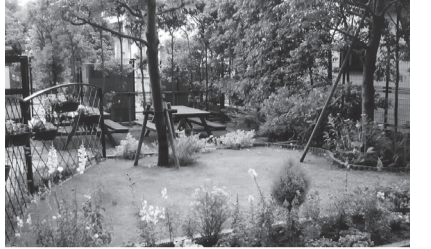
▲前回受賞作。みんなで楽しむ集合住宅のガーデニング

ガーデニングの写真コンテストを実施します。毎年多くの方が来場する展示会で、一生懸命手入れしている庭や花壇を披露しませんか。