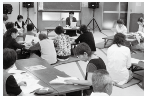
▲出前消費者講座は希望に合わせて開催します

消費生活センターでは、主催の消費生活講座の他、自治会や学校などに出向き、出前消費者講座を行っています。