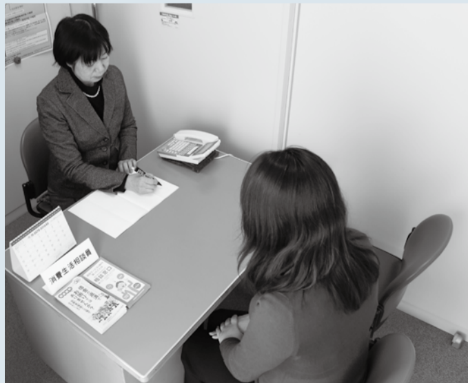
▲一緒に解決に向けて考えていきます

消費生活センターでは、未成年者から高齢者まで、年間約3,000件の相談を受けています。最近増えているインターネットでの通信販売のトラブルでは、業者と連絡が取れなくなるなど、解決が困難な事例もあります。このような悪質商法に遭わないためには、手口を知るなどして未然防止に努めることが大切です。