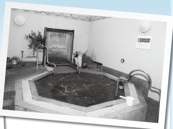
▲四季折おりの色と香りが楽しめる露天風呂

都内や大阪の銭湯を研究し、スーパージェット や電気風呂などを導入したゆープラザ。それら の風呂や、井戸水をまきで沸かしたお湯が好評 で、市内のみならず東京都内から来る常連さん もいるそうです。