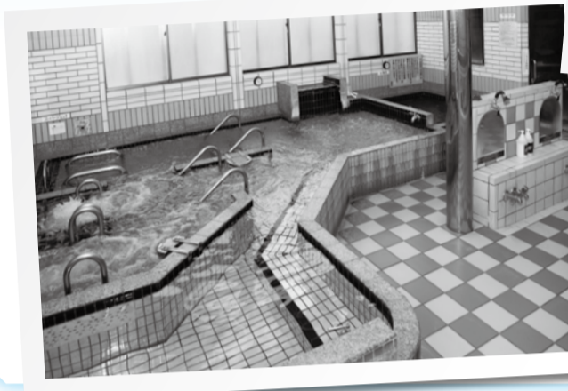
←一番人気のスー パージェット