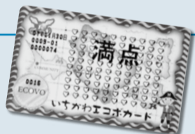
▲エコポ満点カード

毎月26日(ふろの日) 半額 ※「ふろの日」の実施日は事前に各銭湯にご確認ください。 毎月第1・3金曜日 小学生無料 エコポ満点カード 1枚で1人無料