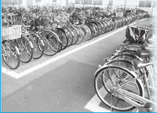
☎712-6342駐輪・駐車施設担当室

申請書は上記施設と ☎市民課、☎総合市民相談課、大柏出張所、市川駅行政サービスセンター、南行徳市民センター、各市営駐輪場で配布している他、市公式Webサイトからもダウンロード可。