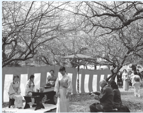
▲梅の香りに満ちた会場

内 悠竹太鼓による演奏、松香園明松園によるバザー、焼きそば・焼き鳥・ポッポーンなどの模擬店 日 3月13日(日)午前9時30分～午後2時 場 じゅん菜池緑地 問 ☎373-5711 梅まつり実行委員会(地域振興課)