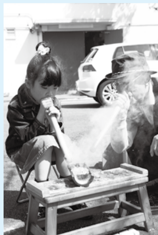
▲現代の便利さを再認識できる火おこし体験

気軽に参加できる、楽しい祭りです。縄文土器によるアサリ汁・火おこし体験まが玉作り・竹細工・メノコ作り・射的・粘土型遊び・紋切り遊び・紙芝居・フリーマーケットなどの催しがたくさんあります。