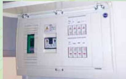
▲住宅の分電盤(写真)に増設し、地震による電気火災を防ぐ「感震ブレーカー(分電盤タイプ)」も、平成27年7月から新たにあんしん住宅助成制度の対象に。

家具をL字型家具や突っ張り棒などで固定し、転倒を防止する他、木造戸建て住宅およびマンションの耐震診断や耐震改修、危険コンクリートブロック除去、あんしん住宅助成制度などの市の助成制度を利用し、地震に備えましょう。