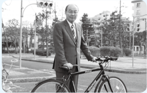
▲自転車の安全利用を呼びかける大久保市長