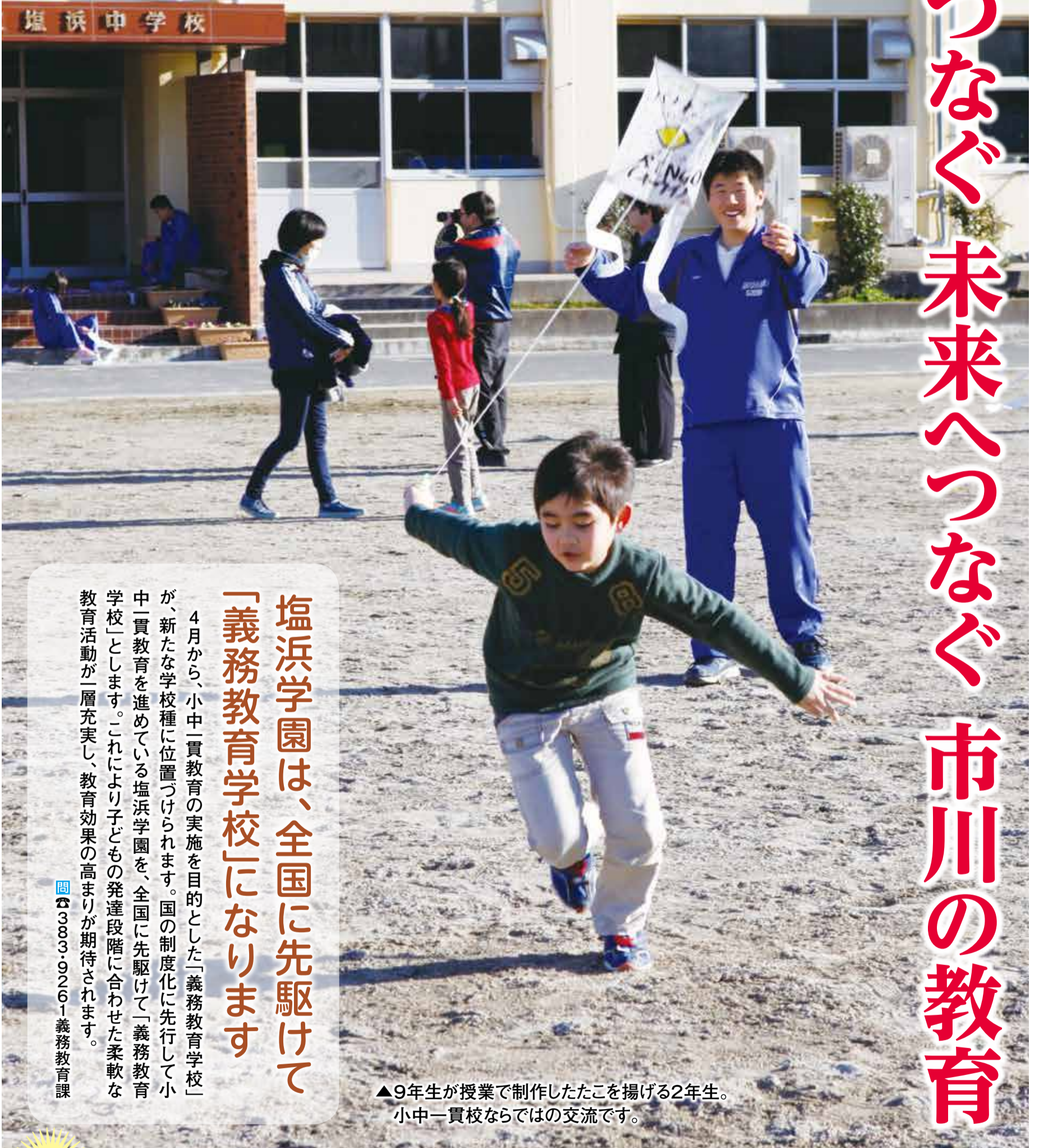
▲9年生が授業で制作したたこを揚げる2年生。 小中一貫校ならではの交流です。