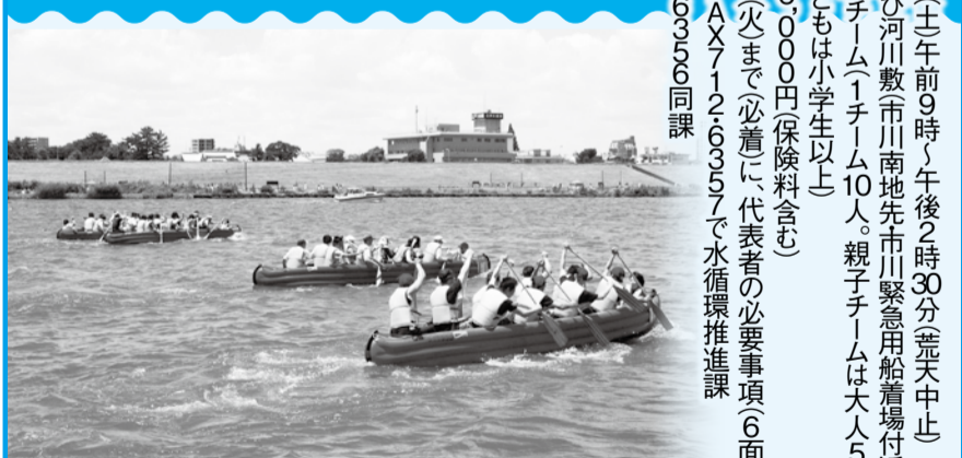
▲水上の熱いレースに奮って参加してください

水の祭典「江戸川・水フェスタinいちかわ」Eボート(ゴム製ボート)レースの参加チームを募集します。服装などの規定は申し込み後にお知らせします。