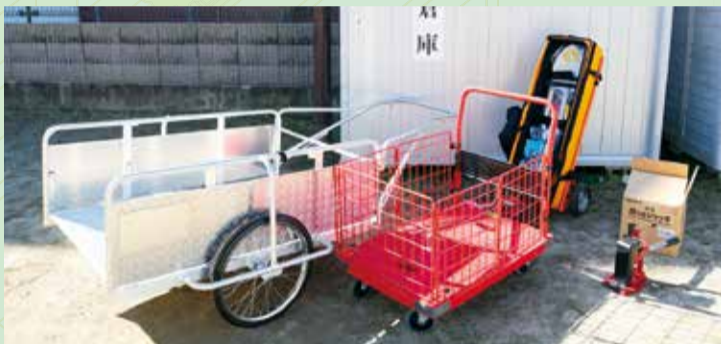
▲リヤカーはコンパクトに畳め、防災倉庫に保管できる

自治会内の防災対策強化のため、昨年自主防災組織を再結成しました。結成後、市の補助金制度を利用し、リヤカーや防災倉庫、ジャッキなどを購入。これらの資機材を使い、昨年8月には子どもを含む70～80人で防災訓練を行うなどの活動を行っています。今後は人の救助など、より実践的な訓練を行い、いざという時に備えたいです。