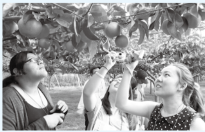
▲梨農園を見学する米国ガーデナ市の青少年代表団

歴史と文化の散歩道 37 異文化の視点から気づく 市川の魅力 近年、増加している外国人観光客は、私たちが何気なく通り過ぎていた風景に興味を持つことも多いようです。そこで今回は、外国人に好評な市内のスポットを紹介しましょう。 一つ目は法華経寺とその参道です。五重塔や祖師堂はもとより、彼らには、参道沿いのお店や、往來の人びととそのすぐ横を走る車や自転車の様子も興味深いようです。また、江戸時代の享保年間(1716～36)からこの地に住み、近代以降に文房具店と「清華堂」という書店を営んでいた石井家の建物であった清華園では、木造瓦葺2階建ての建物を熱心に眺め、畳に座りその感触を楽しむ方もいます。 2つ目のスポットは梨農園です。あるとき、市川の梨の魅力を紹介するために梨農園に外国人をお連れしたところ、収穫作業と出荷準備体験で梨の選別作業に夢中になり、なかなかその場を去りたがらなかったことがありました。 最後のスポットは万葉植物園です。大野緑地内にある和風庭園で万葉集に詠まれている植物が和歌とともに展示されています。 本市は平成24年にフランスのイッシー・レムリノー市とパートナーシップを締結しました。以来、「ICT施策」、「花と緑の街施策」、「文化・芸術」の3つの分野で交流しており、この一環として同市で 近年、増加している外国人観光客は、私たちが何気なく通り過ぎていた風景に興味を持つことも多いようです。そこで今回は、外国人に好評な市内のスポットを紹介しましょう。 一つ目は法華経寺とその参道です。五重塔や祖師堂はもとより、彼らには、参道沿いのお店や、往來の人びととそのすぐ横を走る車や自転車の様子も興味深いようです。また、江戸時代の享保年間(1716～36)からこの地に住み、近代以降に文房具店と「清華堂」という書店を営んでいた石井家の建物であった清華園では、木造瓦葺2階建ての建物を熱心に眺め、畳に座りその感触を楽しむ方もいます。 2つ目のスポットは梨農園です。あるとき、市川の梨の魅力を紹介するために梨農園に外国人をお連れしたところ、収穫作業と出荷準備体験で梨の選別作業に夢中になり、なかなかその場を去りたがらなかったことがありました。 最後のスポットは万葉植物園です。大野緑地内にある和風庭園で万葉集に詠まれている植物が和歌とともに展示されています。 本市は平成24年にフランスのイッシー・レムリノー市とパートナーシップを締結しました。以来、「ICT施策」、「花と緑の街施策」、「文化・芸術」の3つの分野で交流しており、この一環として同市で