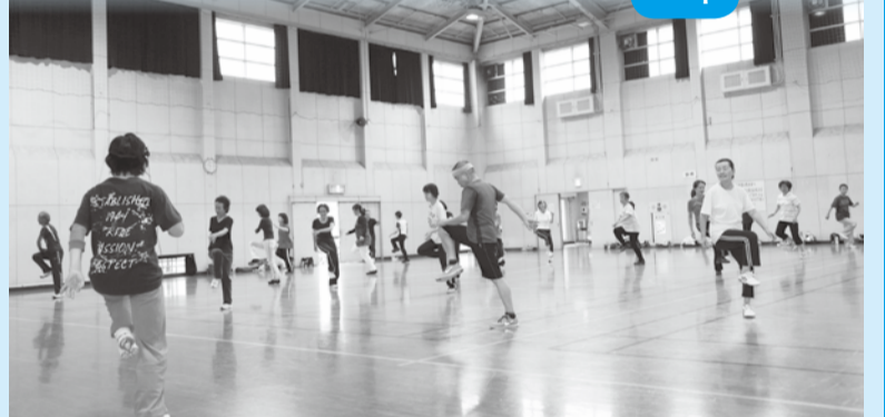
▲軽い有酸素運動で心肺機能を高める「初級者のエアロビクスダンス教室」

申往復はがきに必要な事項(6面上段参照)と会場、教室を第3希望まで書き(はがき1枚につき当選は1教室)、3月15日(火)必着で国府台市民体育館(〒272-0827国府台1-6-4)または、各会場にある申請書に返信用のはがきを添付して申し込み(定員に空きが出た場合は落選者に連絡します) 問 ☎373-3112 スポーツ課