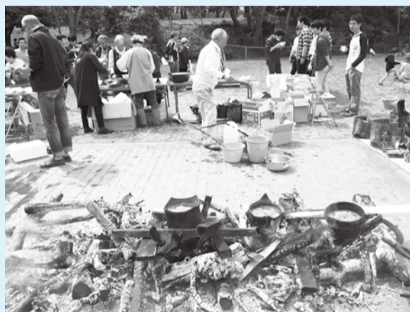
▲縄文土器で煮るアサリ汁を食べてみませんか

日 3月27日(日) 午前10時～午後2時(雨天の場合は縮小決行) 場 考古博物館・歴史博物館・堀之内貝塚公園、他 ※車での来場不可。 ¥ 材料費が必要な企画あり 問 ☎373-2202 同実行委員会事務局(考古博物館)