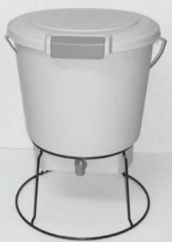
屋内でも利用できる密閉型コンポスト容器

家庭から出る生ごみは、ごみとして出す前に「水きり」、食事は全て「食べきり」、食材を必要分だけ買って「使いきり」することで大きく減らすことができます。それでも出してしまう生ごみは、コンポスト容器を使用して堆肥にしてみませんか。