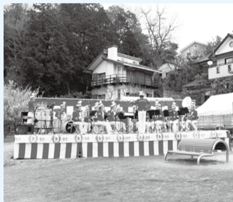
▲消防音楽隊による勇ましい演奏

内 消防音楽隊による演奏、女性消防団員による紙芝居、住宅用火災警報器及びAEDの展示・説明 日 3月13日(日)午前9時30分～正午(雨天時中止。当日6時30分から☎333-3666で確認可) 場 じゅん菜池緑地 問 ☎333-2111 消防局予防課(音声ガイダンス・1番)