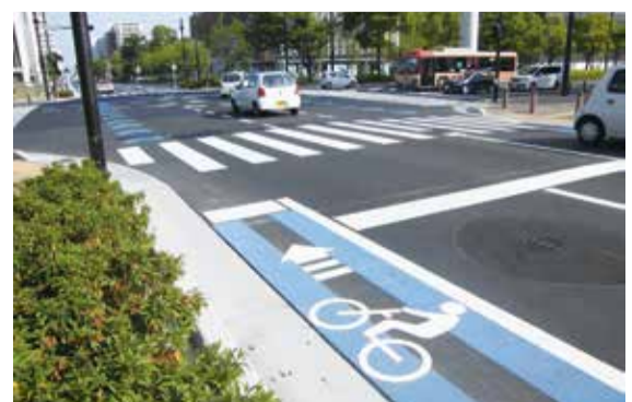
▲すでに利用されている千葉市の自転車レーン (市川市の青いラインは右側の1本です)

市では、自転車の安全利用のために新浜通りの一部に自転車レーンの整備を進めており、平成28年の春の一部が完成します。自転車レーンは、車と同様に道路の左側一方通行です。逆走は大変危険ですので、必ずルールを守りましょう。