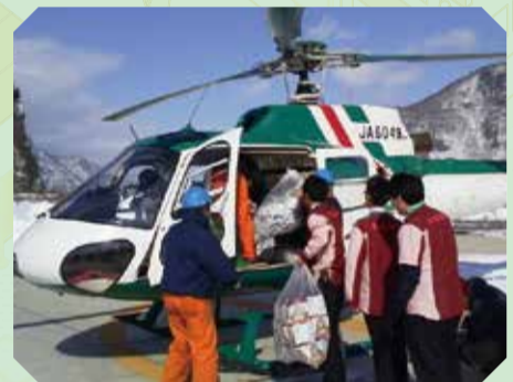
▲長野県の大雪時に物資を供給する様子

現在123の企業や団体などと災害時の救護・救援の他、情報伝達や物資輸送、避難場所の提供など、さまざまな分野について官民の連携を進めています。また、今年度はコストコホールセールジャパン(株)や株セブン-イレブン・ジャパンと災害時の食料品等物資の供給等の協定を交わしました。