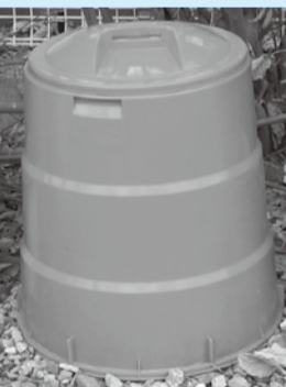
屋外で利用する据置型コンポスト容器

コンポスト容器には市の購入費補助制度があり、容器1基につき購入価格の半分の額(3,000円まで、1000円未満は切り捨て)を差し引いた額で購入できます。購入の際は、住所が確認できるもの(運転免許証など)と印鑑を持って取扱指定店で委任状を書き、購入してください。