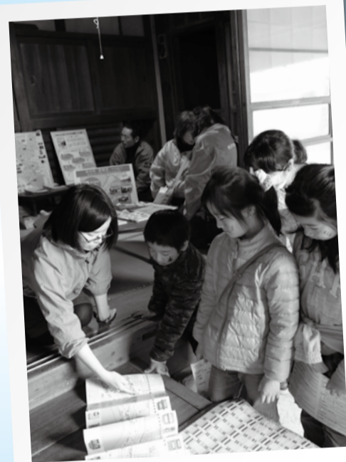
▲岩崎邸では、回遊展の見どころや市の取り組みを職員がご案内