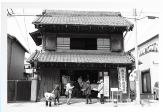
▲国登録有形文化財に登録されている旧浅子神輿店

妙典・本行徳・本塩・関ヶ島周辺の寺などを会場とした「寺のまち回遊展」を開催します。行徳地域の歴史や文化に触れられる郷土史講演会などのイベントの他、座禅体験、お雛子演奏・体験、寺宝見学ツアー、地元サークル発表、音楽フェスティバル、体験スタンプラリー、ミニ喫茶があり、子どもも大人も楽しめます。詳しくは、同実行委員会Webサイトまたは、東西線妙典駅や各会場で当日配布するパンフレットをご覧ください。