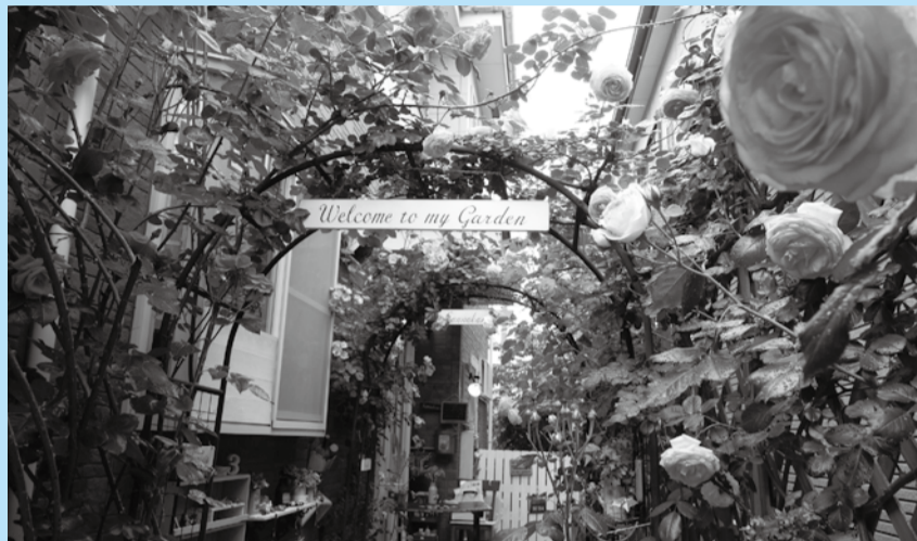
▲趣向を凝らした庭や花壇の写真をお待ちしております

みなさんがお手入れしている庭や花壇の写真を送ってください。毎年多くの方が来場する写真展示会で庭づくりへのこだわりや想いを伝えてみませんか。