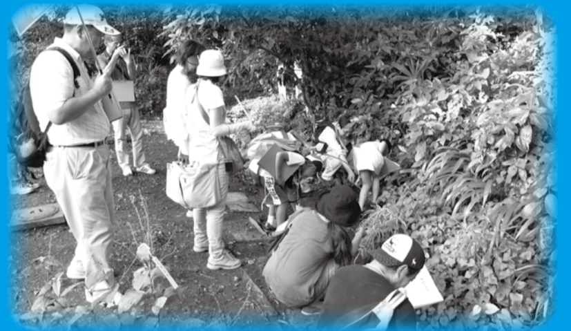
▲市内のクールスポットを巡るなど身近な環境にふれます

▽3歳～高校生までの方(要保護者同伴) ▽4月15日(金)までに☎712-6306環境政策課