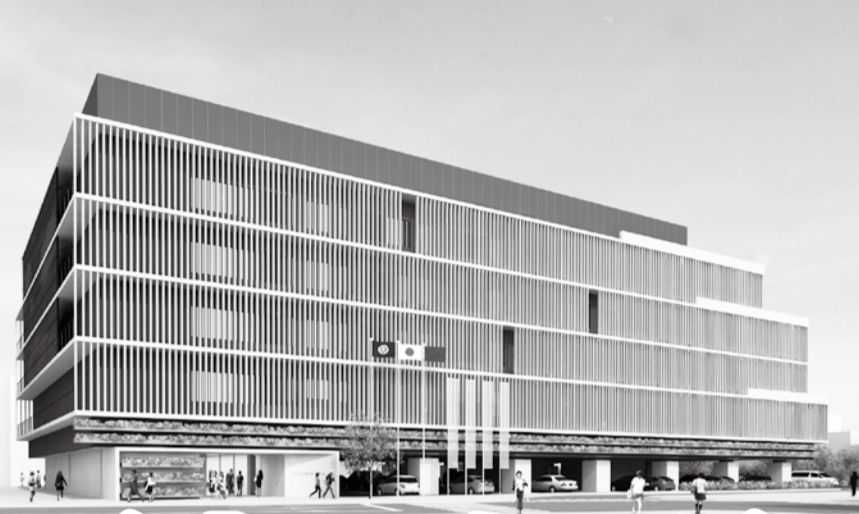
新第2庁舎(イメージ)