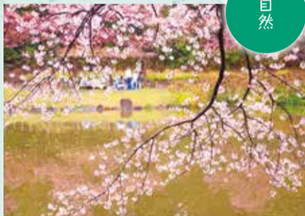
▲じゅん菜池緑地の桜