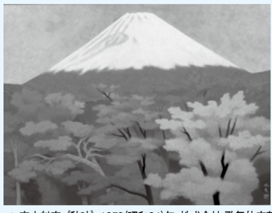
▲東山魁夷(秋映) 1959(昭和34)年、株式会社 歌舞伎座蔵

一階の資料展示では、蘭島閣美術館、並びに、角川文化振興財団の特別協力を得て、杉山寧と高山辰雄の『文藝春秋』表紙絵原画そして、東山魁夷が表紙絵を描き下ろした「歌舞伎筋書」をはじめ、『保健同人』、総合雑誌『日本』を展覧につなげ、三山の表紙絵の世界と、その魅力に触れていただきます。 二階の作品展示室では、杉山寧『鯉』、高山辰雄『月と森と水』、そして東山魁夷『秋映』など、戦後、新しい日本画の伝統を築いた三山の秀逸な日本画に加え、東山魁夷が手掛けた六世中村歌右衛門所用「助六揚巻の衣裳」白地精好波に松島図の襦袢も紹介いたします。近代日本画のうねに偉大な業績を遺した三山の多彩な芸術世界をお愉しみいただける展覧会となっています。東山魁夷記念館を訪れて、三山のデザインの魅力に触れてみてはいかがでしょうか。 (東山魁夷記念館 石田久美子)