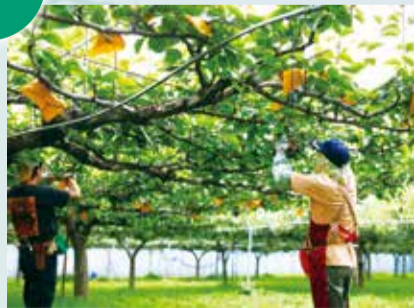
▲北部に広がる梨畑