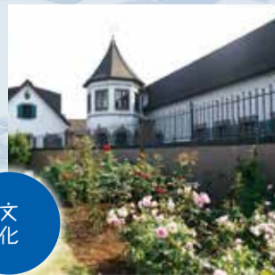
▲西洋風の東山魁夷記念館

歴史あるまち並みと150メートルからの眺め 歴史と近代が共存するまち 堀之内、曾谷、姥山の貝塚などの縄文の遺跡や、万葉集に詠まれた真間の手児奈伝説などが、古来より人が住み栄えてきた地域であることを物語っています。今日でも多くの寺社仏閣や、行徳の旧街道などの歴史あるまち並みと、再開発や区画整理による近代的なまち並みが共存しています。