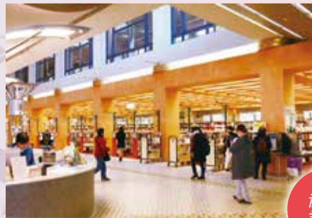
▲約80万冊の蔵書がある中央図書館