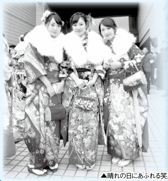
▲晴れの日にあふれる笑顔