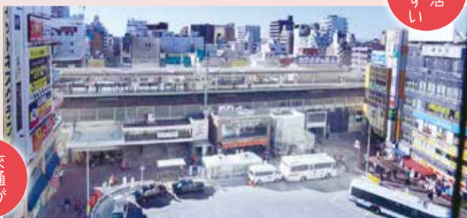
▲乗客数1日平均約5万9千人(平成28年度)のJR本八幡駅