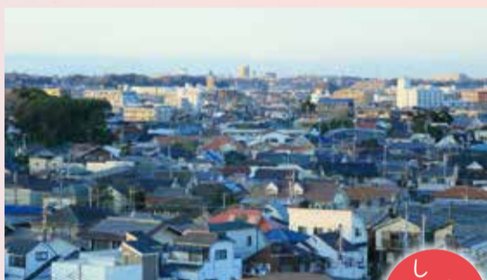
▲発展、成熟した住宅都市