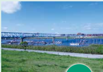
▲悠然と流れる江戸川