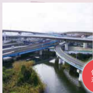
▲東京外かく環状道路が開通予定の高谷JCT