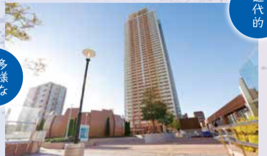
▲地上150メートルからの眺望が楽しめるアイリンクタウン展望施設

歴史あるまち並みと150メートルからの眺め 歴史と近代が共存するまち 堀之内、曾谷、姥山の貝塚などの縄文の遺跡や、万葉集に詠まれた真間の手児奈伝説などが、古来より人が住み栄えてきた地域であることを物語っています。今日でも多くの寺社仏閣や、行徳の旧街道などの歴史あるまち並みと、再開発や区画整理による近代的なまち並みが共存しています。