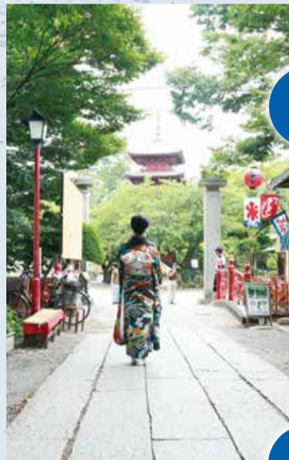
▲日蓮宗大本山である法華経寺の参道

都心近くにありながら、悠然と流れる江戸川の河川敷緑地、大町にある自然観察園、南部の行徳近郊緑地など、水辺と緑地の織りなす美しく多様な自然に恵まれています。また、京成線周辺には市の木であるクロマツも多く、本市固有の景観になっています。