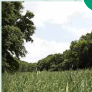
▲谷津を保全する自然観察園