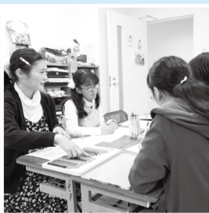
▲和洋女子大学生が苦労して絵札を作りあげました

児童が作成した標語(読み札)に、和洋女子大学の学生が絵を描き、絵札を作成した「環境かるた」で「かるた大会」を開催します。ニッケコルトンプラザ(コルトンホール)に置約100枚を敷き、32人16組の対戦用のかるたを並べ、1対1でのトーナメント方式により勝者を決定します。3位までの入賞者には賞品、また、全員に参加賞があります。応援の方は自由にご覧ください。