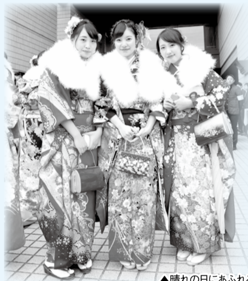
▲晴れの日にあふれる笑顔