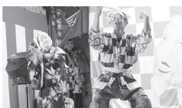
▲囃子保存会によるおかめ・ひょっとこ踊り

日 6月10日(日)午後2時～2時45分 ※座席の用意はありません。 場 アイ・リンクタウン展望施設 問 ☎711-1142 観光交流推進課 イベント用は ☎322-6600 同施設