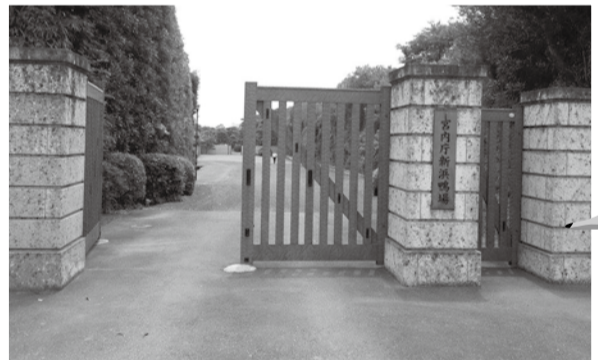
▲宮内庁職員が中を案内します

鴨場は、国内には2カ所しかない貴重な宮内庁施設で、国内外のお客様をもてなす場として利用されています。普段入ることのできない新浜鴨場を市民限定で公開します。 日 7月3日(火)、6日(金)、11日(水) 午前10時～11時30分 場 宮内庁新浜鴨場(新浜2の5の1) 人 市内在住の方、抽選で各35人 申 往復はがき(一枚4人まで)に参加者全員の申し込み事項(6面上段参照)と希望日(1日のみ)、希望集合場所(文化会館または行徳支所)を書き、6月14日(木)必着で広報広聴課(〒272-8501※住所不要。返信宛先は代表者としてください。記載漏れ重複申し込み郵便料金不足は無効。宮内庁に参加者名簿を提出するため、申し込み後の追加変更は不可。) 公開抽選 6月20日(水)午後3時15分/勤労福祉センター本館 問 ☎712-8663 同課