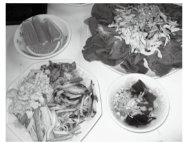
▲男性ならではの豪快な盛り付け