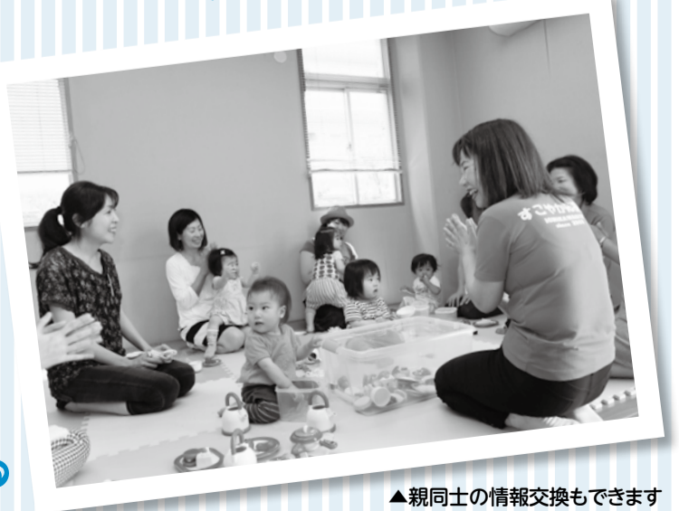
▲親同士の情報交換もできます

9月7日(月)午後1時30分～3時30分 場 大柏出張所 妊婦、0歳～就学前の子どもとその親