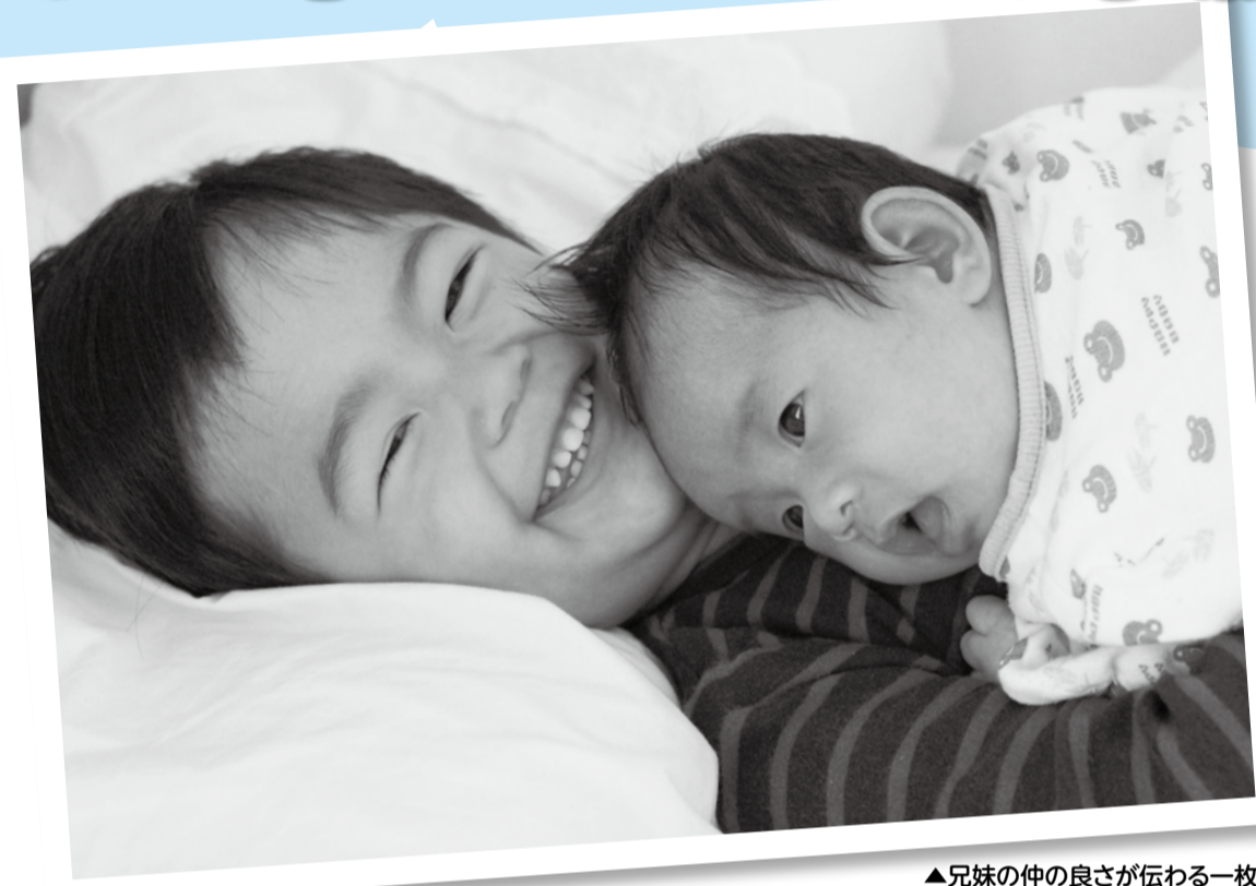
▲兄妹の仲の良さが伝わる一枚です

市内在住・在勤・在学の方 10月23日(金)まで(消印有効)に、応募用紙と写真を子育て支援課(〒272-8501 ※住所不要)へ郵送、または応募用紙と写真を子育て支援課窓口、ニッケコルトンプラザインフォメーションカウンター、行徳支所子育て総合案内窓口のいずれかに