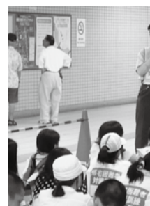
▲駅員の指示に従います

5 災害ボランティア野営体験訓練 ☎8月29日(土)午後3時~30日(日)午前9時 場 大洲防災公園