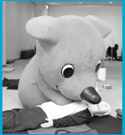
▲ 1日救急隊長としてチーバくんも参加します

9月6日(日)～12日(土)は、救急医療週間です。9月9日(水)の「救急の日」を前に、子どもから大人まで楽しく体験・学習できる「救急広場」を開催します。 会場では、心肺蘇生法やAED(自動体外式除細動器)を使用した救命処置、けがをした時の応急手当の方法などを学ぶことができます。チーバくんが「1日救急隊長」として各イベントをサポートします。