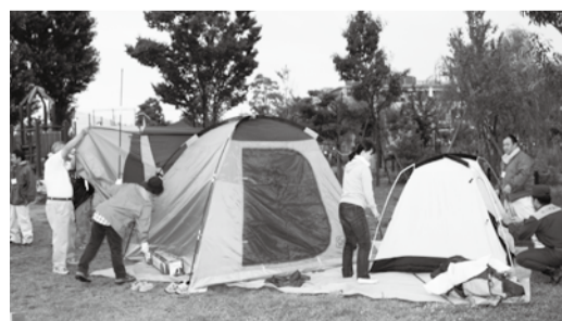
▲ボランティアが被災地で行う活動を体験できます

5 災害ボランティア野営体験訓練 ☎8月29日(土)午後3時~30日(日)午前9時 場 大洲防災公園