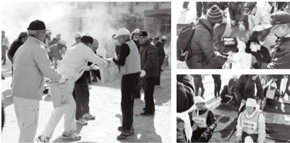
▲地域の方の協力が多くの命を救います

一般参加者による救助救急を行います。阪神淡路大震災の家屋などの下から助け、地域の方の協力により行われます。人命を救う見学のみも可。