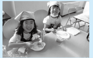
▶自分で作ったおやつはおいしいな