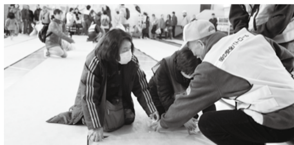
▲避難所をより良い環境に整えます

3 避難所訓練 ☎8月30日(日)午前10時~正午 場 北方・新浜・曾谷・信篤・福栄小学校