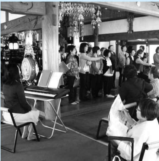
▲毎年の恒例行事となった「寺のまち回遊展」

行徳をもっと住みやすく、そして愛着と誇りを持てるような街にするために、親子あんどん工作教室、ライトアップ、花植え活動や、親子まち探検、寺のまち回遊展などの各種イベントを通じて、行徳地区の歴史や文化の素晴らしさを、市内外の方々に広めています。