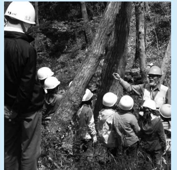
▲森で行われる「自然観察」

大町にある「わんぱくの森」を次世代に引き継ぐために森の整備、保全を行い、夏に開催する森林体験教室を通して自然景観を身近に感じられる機会を提供し、市民に里山景観の大切さを伝えていくことを目的に活動しています。