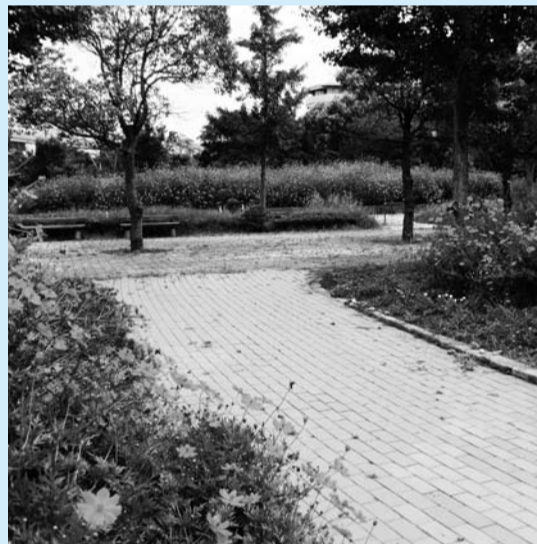
▲秋に咲く「キバナコスモス」

主に南行徳地区(江戸川第二終末処理場など)で、公共施設の花壇、道路沿いの空き地などにシバザクラやバラなどの苗を植え、1年を通して花が楽しめるように管理しています。街に彩りを添えることで美しい景観をつくりだし、安らぎの場を提供しています。