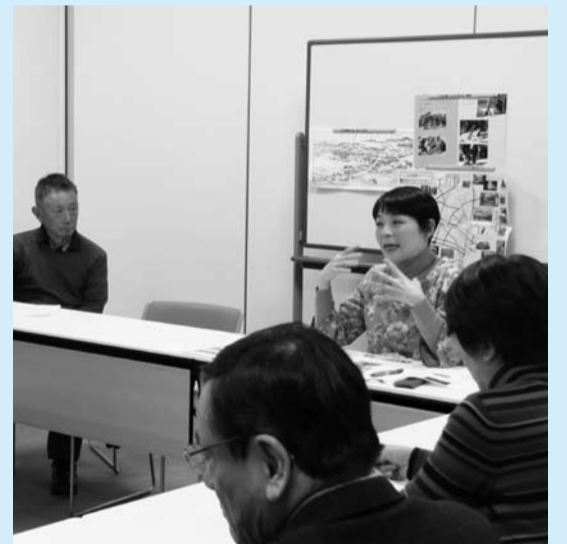
▲定期的に行われる「まちづくり勉強会」

市民の交流と専門家の協働を基本として、住環境、景観、歴史と文化の充実と向上を共通の目的として、市のシンボルである「クロマツのある風景」の保全、復活や、景観まちづくり活動に取り組んでいます。今年は勉強会やまち歩きワークショップ、シンポジウムを開催します。