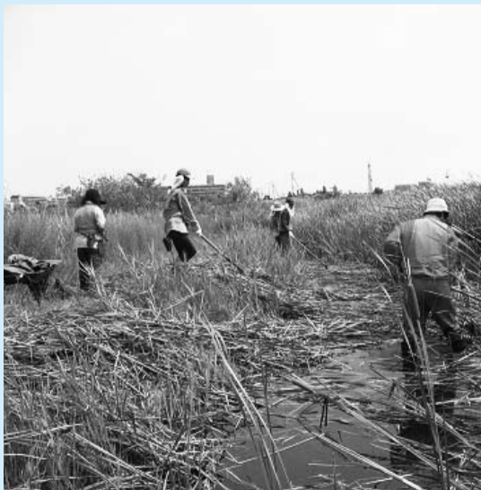
▲大柏川第一調節池緑地内の除草活動

環境教育・啓発に関する事業を通じて、地域の教育、学習活動などに参加することを目的として、大柏川第一調節池緑地の自然の素晴らしさを多くの市民に知ってもらうため、市、県、市民とともに自然環境の保全に取り組んでいます。大柏川ビジターセンターでは、生物写真の展示も行っています。