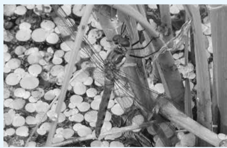
▲イネの根元で羽化したアキアカネ

都市化した市川市だからこそ、田んぼという場と、そこで暮らす生きもの、また、稲作にまつわる民俗などを後世に伝えていくことは、大切なことと言えるでしょう。(自然博物館金子謙二)