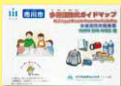
▲多言語防災ガイドマップ