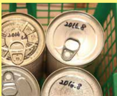
▲賞味期限が大きく書いてあるので、一目でわかる

東日本大震災で塩浜地区が液状化し、約1週間断水しました。自宅に被害がなく下水道も使えたことから、自宅を避難場所として備蓄品を活用する「在宅避難」をしました。備蓄といっても特別な非常食ではなく、普段から冷蔵庫や冷凍庫・台所の食材置場にレトルト食品や缶詰・冷凍食品などを多めに保管し、食べたら買い足す、という普段の食料を循環させるようにしています。