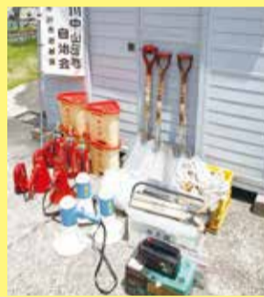
▲元消防士の住民が災害時のロープの活用方法を教えるなど、住民間の連携も

20年程前から、自治会で自主防災組織を結成しています。倉庫には、スコップや消火用具のほか、市の補助金で購入したリヤカーなどもあり、毎月の点検と動作確認を欠かさず行っています。防災訓練は、地域の高齢化などもあり、自治会単独で訓練するより、市の総合防災訓練に参加し、防災の意識やノウハウを学ぶことを主体としています。昨年は自治会内から50人が参加、今年は100人を目標に市の訓練に参加し、地域の防災意識向上につなげたいです。