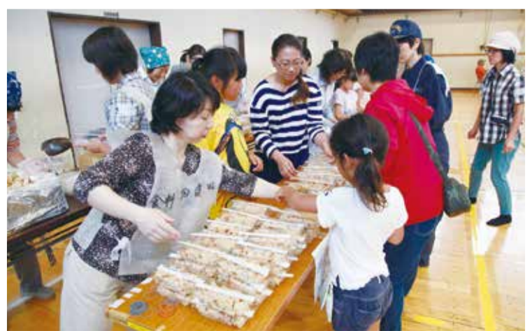
▲非常食を使った炊き出し訓練

市川災害ボランティアネットワークによる指導のもと、炊き出しやテント設営、ロープワークなどの訓練を1泊2日で行います。 日 8月27日(土)午後3時～28日(日)午前9時 場 大洲防災公園 人 先着30人 申 8月26日(金)までに ☎3326-1284 ボランティア・NPO課