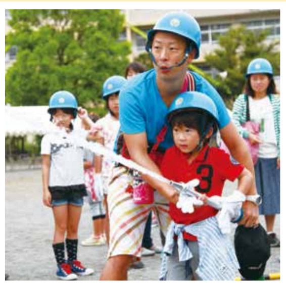
▲力を合わせて火を消そう

災害時に落ち着いた行動をとるためには、災害発生時に何をすべきか、みなさん一人ひとりが日ごろから考えておくことが大切です。災害への備えについて考えるきっかけに、近くの訓練に参加しませんか。下記の①～④の訓練は、いずれも申し込みは不要です。直接会場にお越しください。