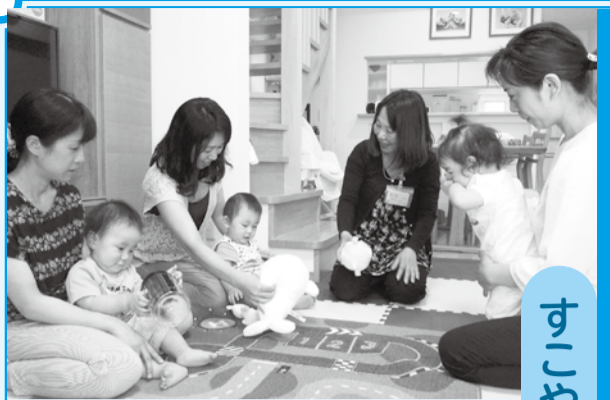
一緒に子育てを考えます

子育ての疑問や心配に保育士や栄養士が答えます。電話窓口相談の他、自宅や公園、公共施設を訪ねて、お子さんと一緒に遊びながら関わり方をお話ししたり、離乳食を作ったり食べている様子を見ながら、子育てのことを一緒に考え、具体的・実践的にアドバイスしています。友だち同士、グループでの訪問も受け付けています。お気軽にご相談ください。