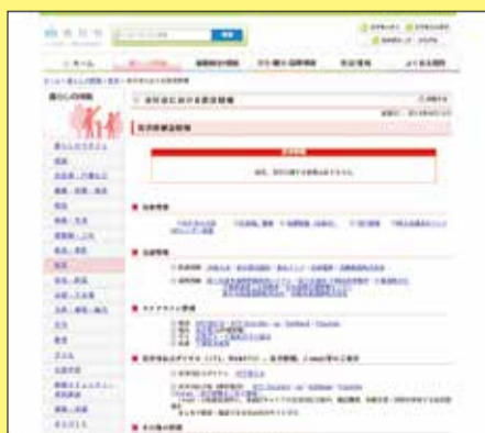
▲災害時には、市内の状況やライフライン情報などをタイムリーに掲載