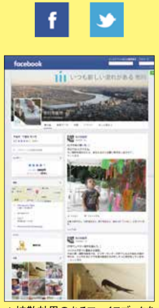
▲拡散効果のあるフェイスブックを活用し、より多くの方に災害情報を発信しています