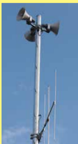
▲災害時はメール情報配信サービスでも放送内容を確認できます

市内207カ所に設置しているスピーカーから、災害時に緊急情報を一斉にお知らせします。また、放送内容を防災行政無線テレホンサービスや市公式Webサイトなど、さまざまな手段で確認できます。