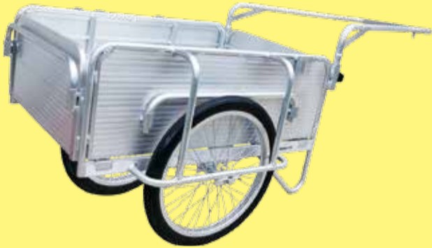
▲災害時、車の通行できない所では、皆で引っ張るリヤカーが活躍します

災害時にこの自主防災組織が効果的に活動し、被害を最小限に抑えるために、地域がどのような人たちが構成されているかをよく知り、それに合わせた訓練や資機材の準備を行う必要があります。地域での訓練の仕方など、詳しくはお問い合わせください。