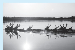
協力: 星野道夫事務所

10/1(日)～15(日) ¥500円、65歳以 上400円、高・大生 250円、中学生以下 無料