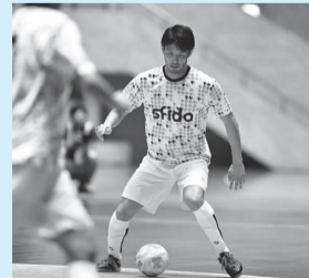
▲元プロフットサル選手 川股要佑氏