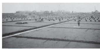
▲大正5年、原木 地の塩田の様子

江戸時代以降、日本国内では瀬戸内 地方などで製塩が行われており、行徳地 域も有力な製塩地でした。世界各地と の比較を紹介しながら、日本の製塩の歴 史について学びます。