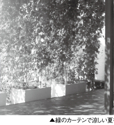
▲緑のカーテンで涼しい夏を