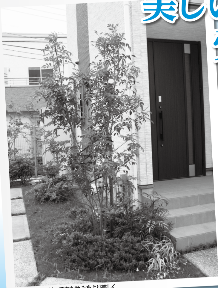
▲シンボルツリーでまち並みをより美しく