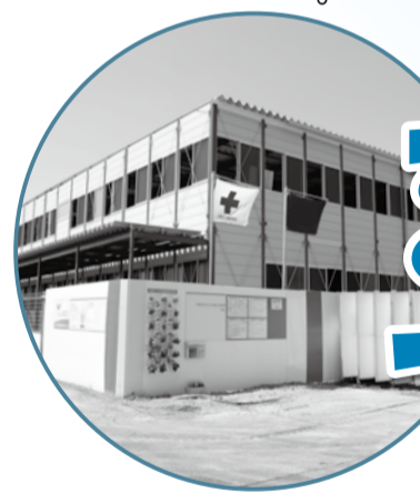
▲市川南仮設庁舎(建設中)