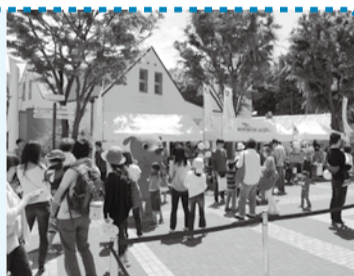
▲昨年の1%スタートフェスティバル

あなたが昨年度に納めた個人市民税の1%相当額を、選んだボランティア団体の支援にあてることができます。