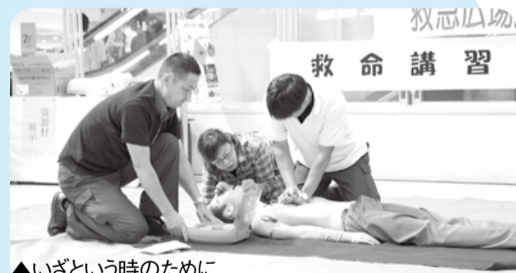
▲いざという時のために

応急手当の目的および重要性、止血の方法、骨折の応急処置の方法。 日 4月22日(土) 午前9時～正午