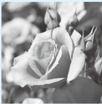
▲やわらかいピンクのローズいちかわ

申し込み不要。当日直接集合場所へ。 コース(約8キロメートル) JR市川大野駅(集合)→万葉植物園→大野城跡→法蓮寺→駒形大神社→動植物園バラ園(昼食)→長田合津→札林寺→天満天神宮→JR市川大野駅(解散) 日5月23日(火)午前10時(集合は5分前)～午後3時(小雨決行) 物 昼食、飲み物 問 ☎324-7751同会 (観光交流推進課)