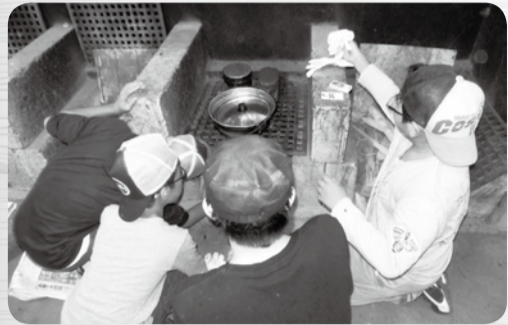
▲真剣に火おこしも学びます

日①6月18日(日)②7月9日(日)③行徳会場=8月25日(金)~26日(土)または八幡会場=8月26日(土)~27日(日)④10月15日(日)⑤10月29日(日)の全5回 場 八幡小学校または行徳小学校(会場を選択)、いちかわ市民キャンプ場、少年自然の家 人 小学5・6年生、各会場抽選で50人 ￥700円(別途キャンプ費用あり) 申 申込用紙(学校や子ども会を通して配布、市公式Webサイトからもダウンロード可)を6月2日(金)必着で青少年育成課(〒272-0023南八幡1-17-15)に郵送または持参 問 ☎383-9419同課