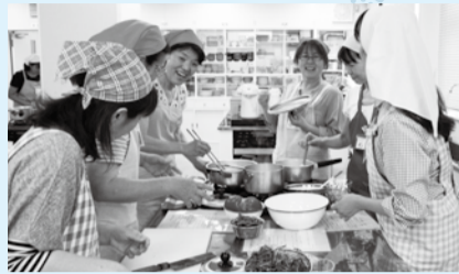
▲ヘルスマイトが紹介する健康レシピ

高めの尿酸値はメタボのサイン。早めの対策が健康への第一歩です。今日からできる食習慣のコツと健康でおいしいレシピを紹介しします。