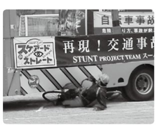
▲スタントマンの迫力ある実演

スタントマンが交通事故を再現する「スケアード・ストレイト方式」の自転車交通安全教室を実施します。交通事故の怖さを直視し、交通ルールを守る大切さを学べる貴重な機会です。