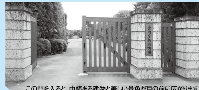
この門を入ると、由緒ある建物と美しい景色が目の前に広がります

鴨場は、国内外のお客様をもてなす場で、国内には2カ所しかない貴重な宮内庁の施設です。普段は入ることのできない新浜鴨場を市民限定で公開します。