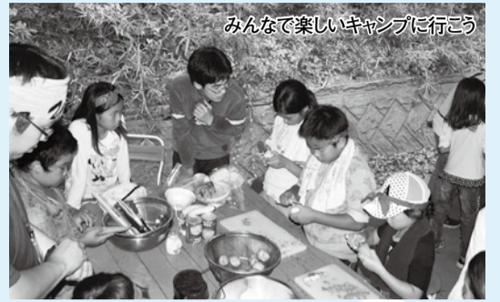
みんなで楽しいキャンプに行こう

7月15日(土)～8月31日(木)の市民キャンプ場の市内団体利用受け付けを開始します。(8月24日(木)～27日(日)は市主催事業のため、利用できません) なお、市外団体及び個人利用は6月27日(火)から電話で仮予約を受け付けます。