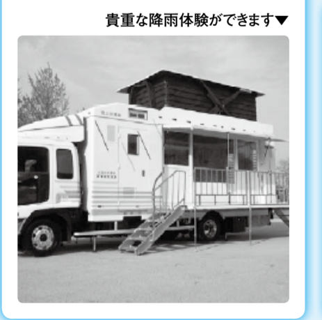
貴重な降雨体験ができます▼

段ボールの間仕切り、畳を用意した避難所スペースを体験できます。また降雨体験車や消防局による救急対応、救助犬のデモンストレーション、避難所でのペット用品、子ども遊び体験などもあります。