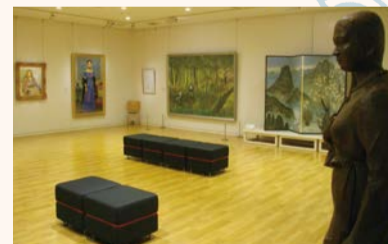
▲中山メモリアルギャラリー

の第2土曜日にはニューボロイチが開催されています。こちらは実行委員会が中心となり、手作りが満載で、ワークショップの体験もできる新しいイベントです。次のニューボロイチは、10月19日(土)に開催の予定ですが、日程が変更となる場合がありますので、Webなどで事前の確認をお願いします。