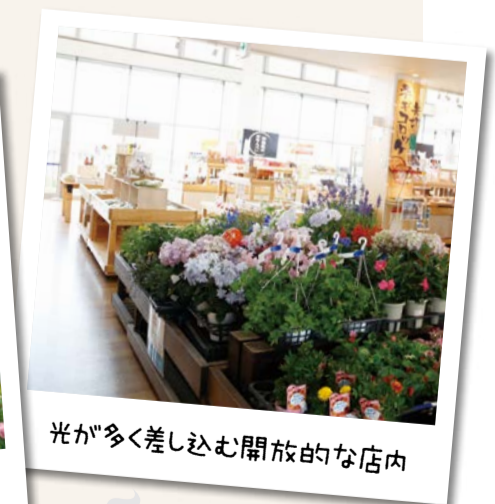
光が多く差し込む開放的な店内