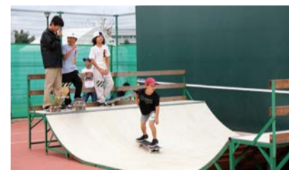
▲スケートボードにチャレンジ