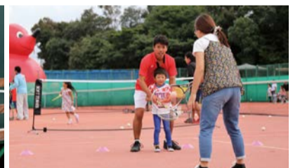
▲教室では丁寧に教えてくれます