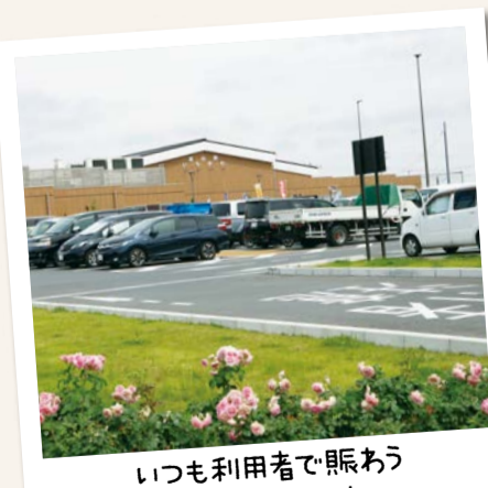
いつも利用者で賑わう 道の駅いちかわ

平成30年4月にオープンした道の駅いちかわは、市民にとって身近な存在。ショップには地域の新鮮食材や特産品、パンや和菓子におにぎりといった軽食が並びます。今年7月にメニューを一新したイタリアンレストランでは、地元農家が育てた野菜やハーブを使ったランチを楽しめ