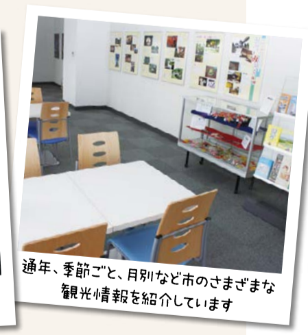
通年、季節ごと、月別など市のさまざまな観光情報を紹介しています