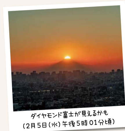
ダイヤモンド富士が見えるかも (2月5日(水)午後5時01分頃)

📍 市川南1-10-1ザ・タワーズ ウェスト45階 開所時間 午前9時～午後10時(ただし展望デッキは午後9時まで)アイ・リンク情報コーナー(カフェスペース)は午前11時～午後6時 休所日 毎月第1月曜日(祝日にあたる場合は直後の平日)、年末年始(12月29日～1月3日) 📞 ☎322-9300