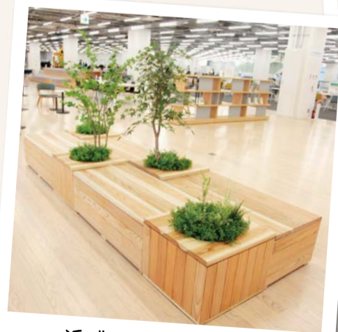
近づくとも心地よい音が聞こえてきます