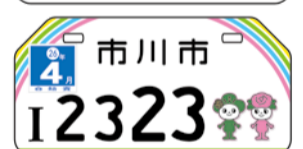
▲市川市のナンバープレート例(80周年記念ナンバープレート)