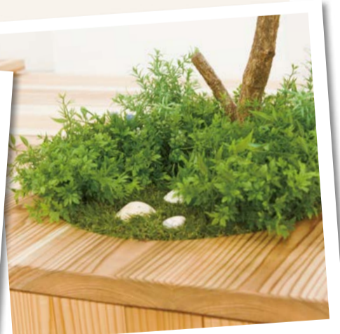
貝殻の上に手をかざしてみてください