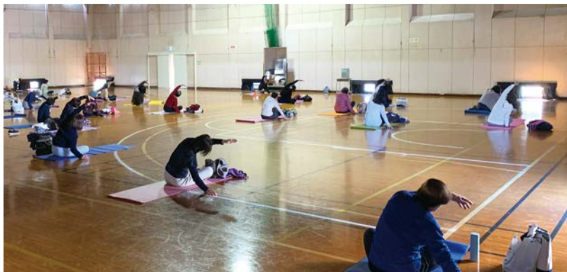
▲初心者のヨガ教室の様子