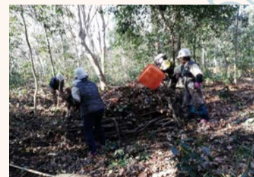
▲ボランティアによる小塚山の管理作業風景

葉の絨毯と冬木立が延々と続いていました。しかし、便利な肥料や燃料の普及により里山の役割が失われ、雑木林が放置されるようになって半世紀以上がたちました。それでは、雑木林は今どうなっているのでしょうか。自然の流れとしては、低木から高木まで日陰に強い常緑広葉樹が勢力を伸ばし、暗い常緑広葉樹林に移行しつつあります。また一部には外来種のモウソウチクによる竹林化が進み、多様な生き物の暮らしが損なわれようとしています。