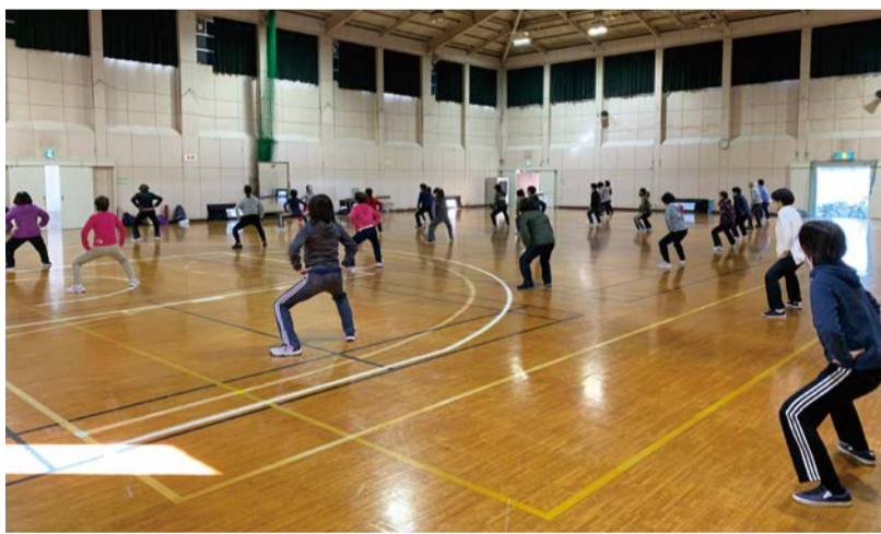
▲初級者のエアロビクスダンス教室の様子