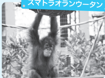
スマトラオランウータン