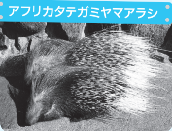
アフリカタテガミヤマアラシ