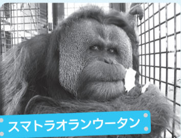
スマトラオランウータン