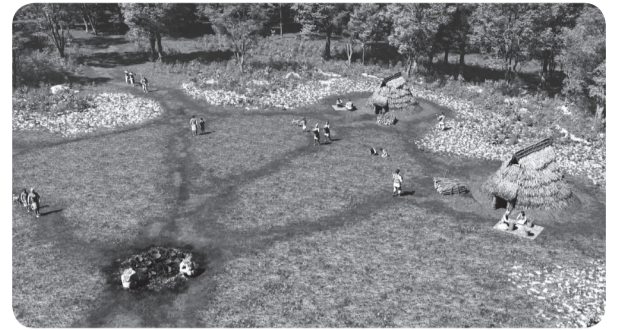
▲縄文時代の堀之内貝塚の様子