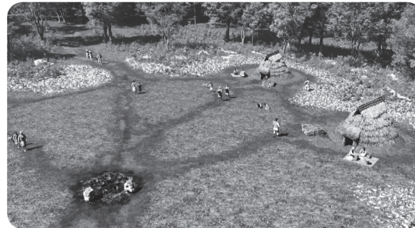
▲縄文時代の堀之内貝塚の様子