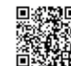
◀市川市DX憲章はこちらから

本市では、「市川市DX憲章」に基づき、DXを進めています。詳しくは市公式Webサイトを確認ください。