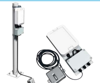
▲道路冠水センサー