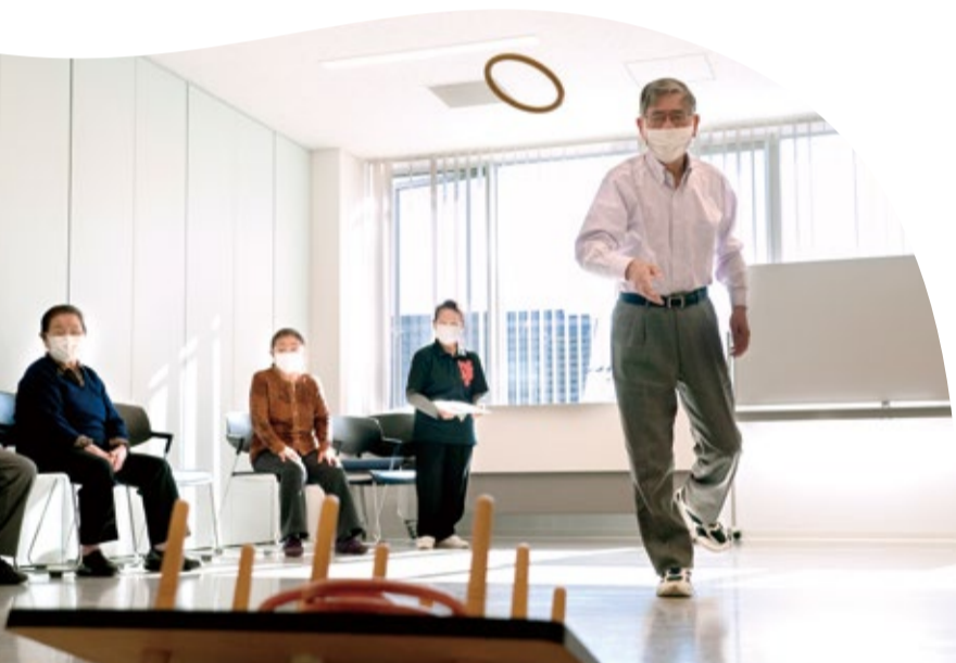
図 ☎712-8518地域支えあい課

をすることだけではなく、例えば、趣味や学びのために仲間と集まるの、できることを活かして、さらにあなたらしい生き方を輝かせるこの号では自分らしく活躍されている方々にお話を伺いました。まずは自