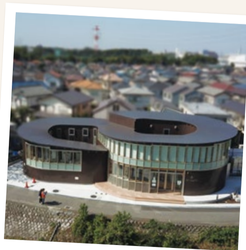
木造を基調とした 優美な曲線からなる建物

また、1階にカフェを設置していますので、ご来館の際には豊かな自然に癒やされながら、ゆったりとした時間をお過ごしください。