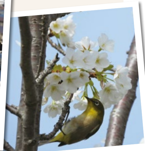
かわいい鳥たちが待っています