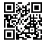
▲特設Webサイトはこちら