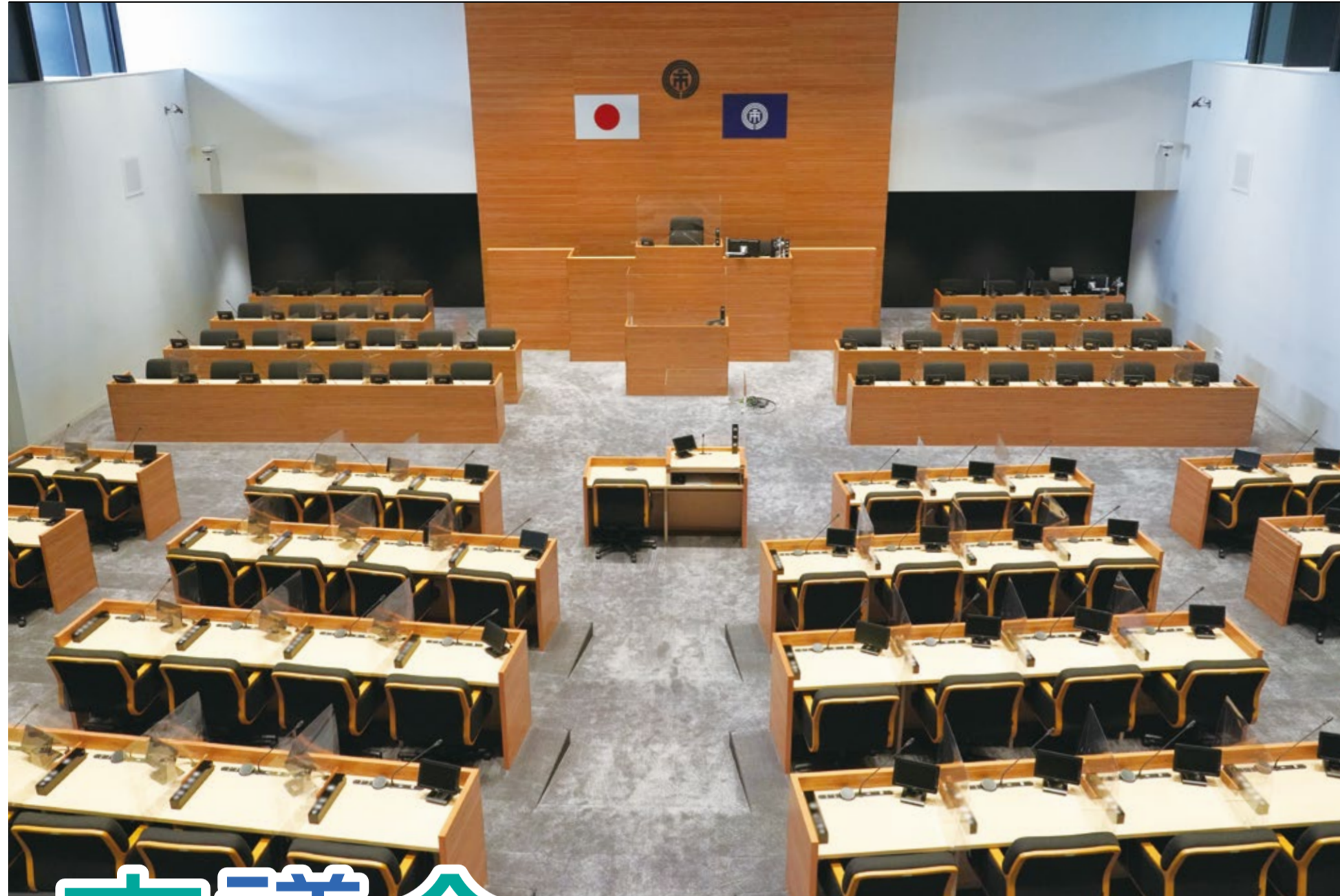
▲傍聴席から見た議場