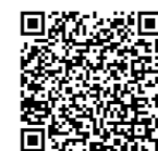
▲議員名簿はこちら

本市の市議会議員の定数は条例で42人と定められており、4年に1回の市議会議員一般選挙で選ばれます。本市では令和5年4月23日の選挙で42人の市議会議員が選ばれました。任期は同年5月2日～令和9年5月1日まで。