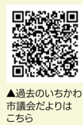
▲過去のいちかわ市議会だよりは