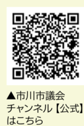
▲市川市議会チャンネル【公式】はこちら

もっと詳しく知りたいときは いちかわ市議会だよりを発行しています 議会の活動内容を分かりやすくお知らせするいちかわ市議会だよりを2月、5月、8月、11月の第2土曜日(定例会号)、1月1日(新年号)に発行しています。新聞折り込みや市内の広報スタンド、公共施設などで配布しています。