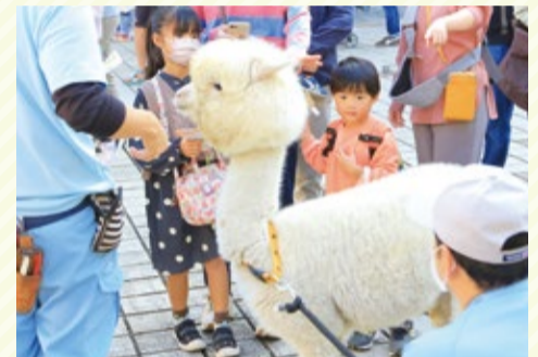
▲アルパカとふれあう子どもたち

かるたには全ての動物の名前が入っています。かるたで楽しく学び、そして動物園で本物の動物たちと会ってみてはいかがでしょうか。