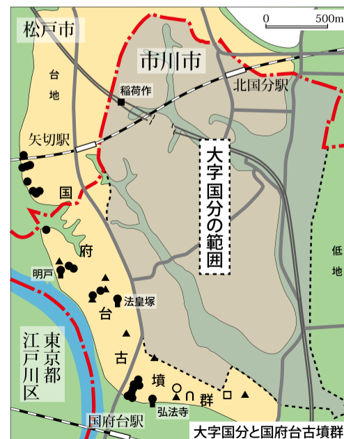
前方後円墳 ■方墳 ●円墳 ▲埴輪片出土 ▢横穴墓? (白抜きは位置が確定していない、古墳が否か疑われている、など)