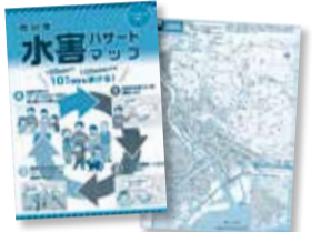
市川市水害ハザードマップ ▶

自宅の水害リスクを確認しておきましょう。安全が確保できれば自宅上階や知人宅への避難も選択肢の一つです。 また、「いつ」「だれが」「なにをやるのか」といった「マイタイムライン」を決めておくことで安心です。詳細は同マップで確認してください。