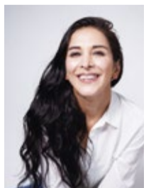
▲サヘル・ローズ氏