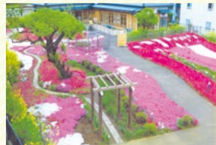
▲芝桜が咲き誇っていた頃の様子