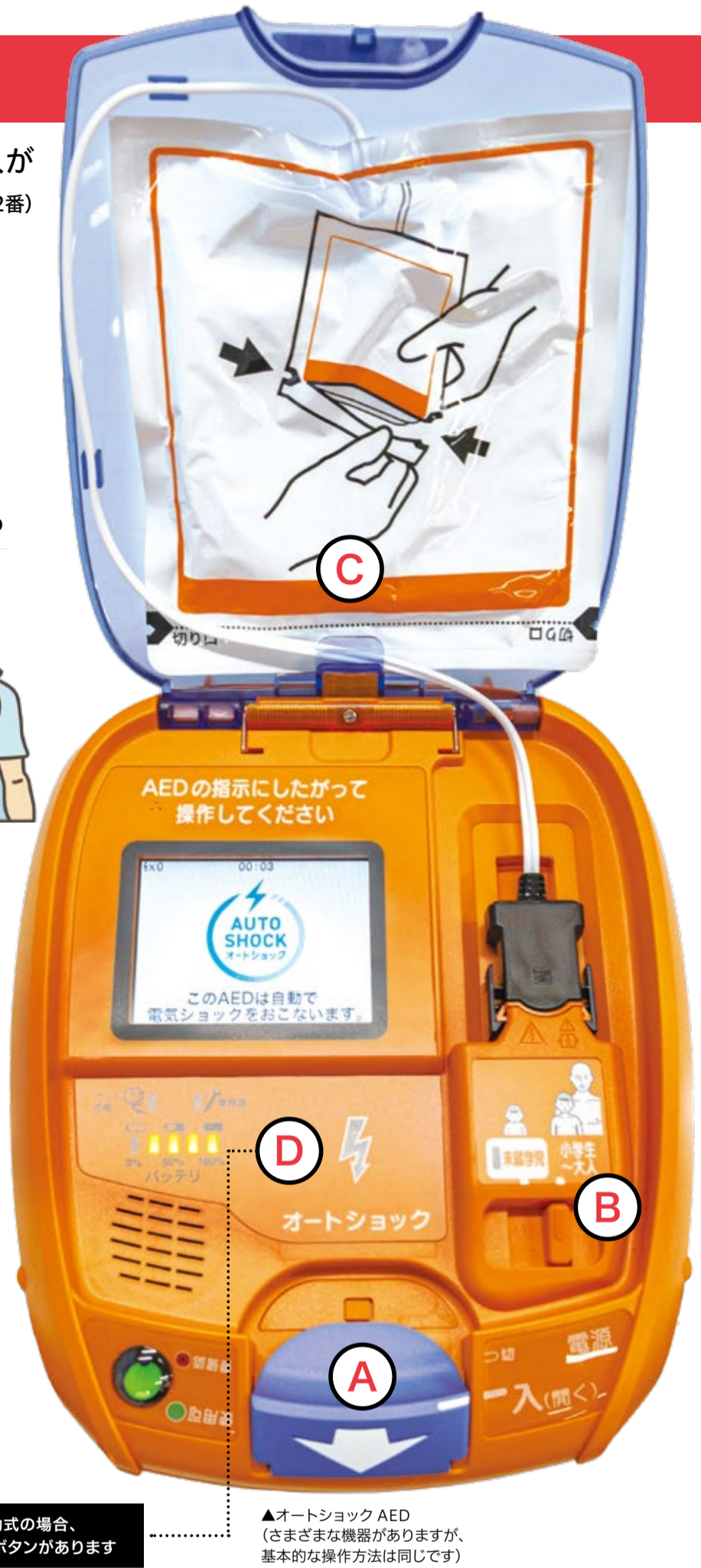
手動式の場合、ショックボタンがあります