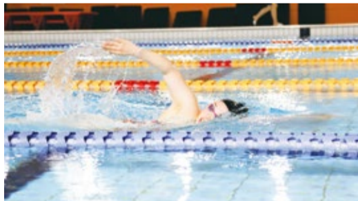
※障がいの種類や程度によって分けられた競技クラス

両 親が水泳の選手やコーチをしていたこともあり、小学3年生から本格 的に始めましたが、大学入学時に黄斑ジストロフィーという目の病気が発 覚し、パラ水泳に転向しました。幼い頃によく家族と行徳のステーキ屋 さんでご飯を食べましたし、最近は市川市へ一人で買い物に行くこ ともあります。パラリンピックでは、どのレースでも自己ベストを更 新することが目標で、そこにメダルがついてきたら良いと思っ ています。みなさんの応援が力になります。SNSへのコメン トも全て見ていますし返信もしますので、たくさん応援して もらえるとうれしいです。