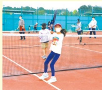
▲テニスを楽しむ子どもたち