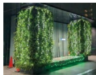
▲昨年のライトアップの様子

メンタルヘルスに対する関心を高め、偏見をなくし、正しい知識と理解を深める趣旨に賛同して、第1庁舎正面玄関でライトアップを行います。