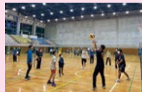
▲ミニバレーボールを楽しむ子どもたち