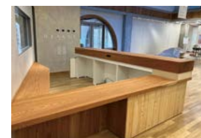
▲1階受付カウンター

この場所に以前建てていた中央公民館の部材が、南側入口上部の化粧彫刻(1面表紙参照)や1階の受付カウンターなどに使われています。みなさんに愛された中央公民館の歴史を、八幡市民交流館は受け継いでいます。