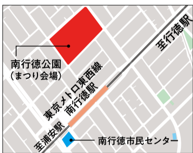
行徳まつり会場はこちら