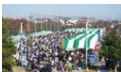
いちかわ市民まつりの様子