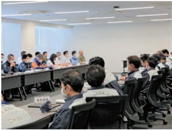
本番を想定しての災害対策本部の会議の様子