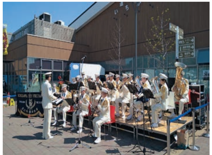
道の駅いちかわで活動する消防音楽隊