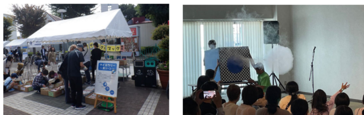
図 2-6-2 いちかわ環境フェアの様子

市及び協議会は、広報紙やホームページ、SNS等の様々な媒体や、いちかわ環境フェア等市内で開催されるイベントの機会を活用し、地球温暖化防止や気候変動への適応に必要な情報を提供し、市民や事業者の取組の推進につなげていきます。