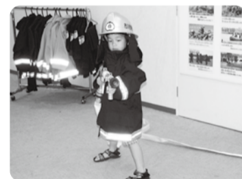
▲子ども用防火服で記念撮影

なりきり消防士体験や救命処置法、119番の模擬通報体験ができます。また、問題となっているリチウムイオン電池からの火災予防や感震ブレーカーの説明も行います。お子さんと一緒にお立ち寄りください。チーバくんにも会えます。