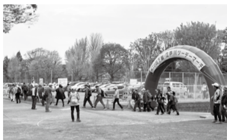
▲元気よくスタート

日 4月11日(土)・12日(日) 場 スポーツセンターを中央会場とした市内及び近隣市 人 市民など(市内在住・在勤・在学の方)、他 料 事前申込(2日間)=1,000円(当日申込600円/1日)、中学生以下・障がい者(介助者1人)=無料。市民等以外の事前申込(2日間)=2,000円(当日申込1,200円/1日) 申 パンフレットに付属の払込取扱票を使用して参加申込、または右記2次元コードから申込可(別途手数料が発生します) 問 318-2013スポーツ推進課