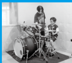
▲初心者向けドラム講座 場 おながくしつ2