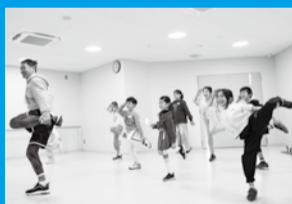
▲ヒップホップダンスを踊ってみよう 場 かつどうしつ