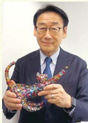
▲いただいた作品と一緒に

オープンハウスを開催します。オープンハウスは、展示パネルや断熱窓を体験できるブースを設けています。 ☎2月28日(土)午前11時～午後4時 場 イオン市川妙典店(妙典5-3-1 3番街2階) ☎712-8634事業推進課