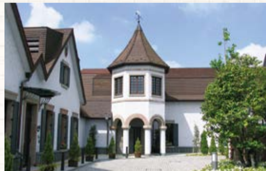
▲東山魁夷画伯の芸術の方向性に影響を与えたとされる、留学の地ドイツに発想を得た西洋風の建物

費用一般1,000円、65歳以上800円、大学生・高校生500円、中学生以下無料