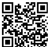
オンライン申請 QR コード

(4) 不備のある場合を除き、原則、申請日の翌々週の金曜日以降に ICHICO 10,000 ポイントを付与します