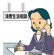
画像は消費者庁イラスト集より

消費生活センター休業日のご相談は、 消費者庁 消費者ホットライン 局番なし188番（いやや）にお電話ください。