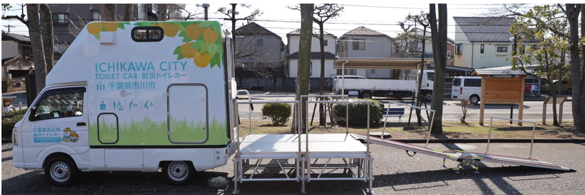
▼ 踊り場・スロープ展開時