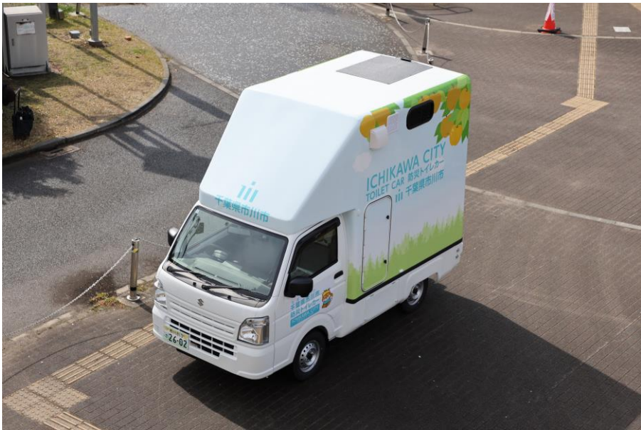
▲ 外観 (上)