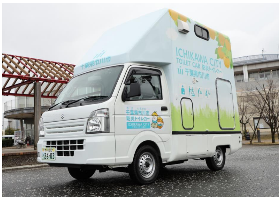
▲ 外観 (左)