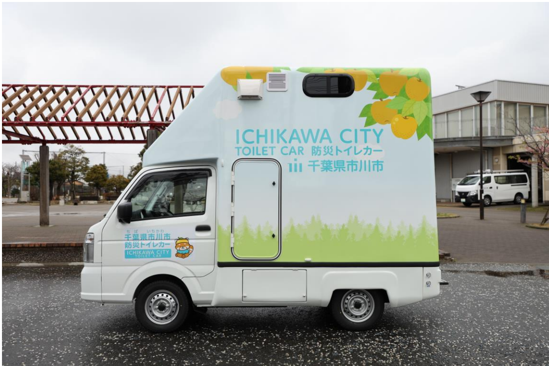
▼ 外観 (左) ・ (後)