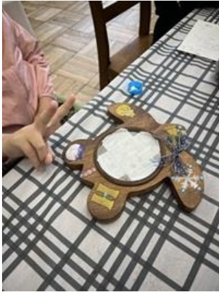
トールペイント風 ミラー

昨年度もサッカー教室、英語教室、季節の工作を中心に、さまざまな活動を行いました。その他夏休みには『夏祭り参加』、『映画観賞』をしました。