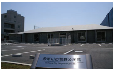
菅野公民館（平成23年4月開館）