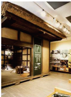
第4室 台地の人々の生活のコーナー

〒272-0837 市川市堀之内2-27-1 TEL 047-373-6351 FAX 047-372-5770