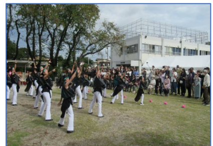
元気いっぱいキッズダンス