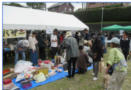
こころウキウキ バザー