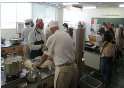
おいしい手打ちそば(新そば)