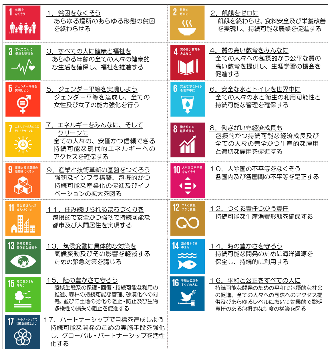
図1-1 SDGsの17のゴール

本計画では、環境と関連の深いゴール3、4、7、11、12、13、14、15、17を踏まえて、施策を展開していきます。