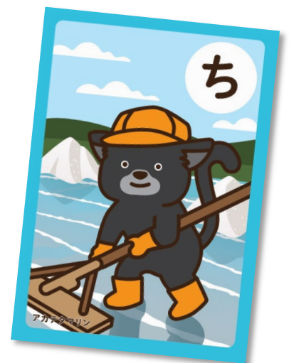
いちかわかるた（詳細は p. 69 へ） 「地域遺産 地名に残る 塩づくり」