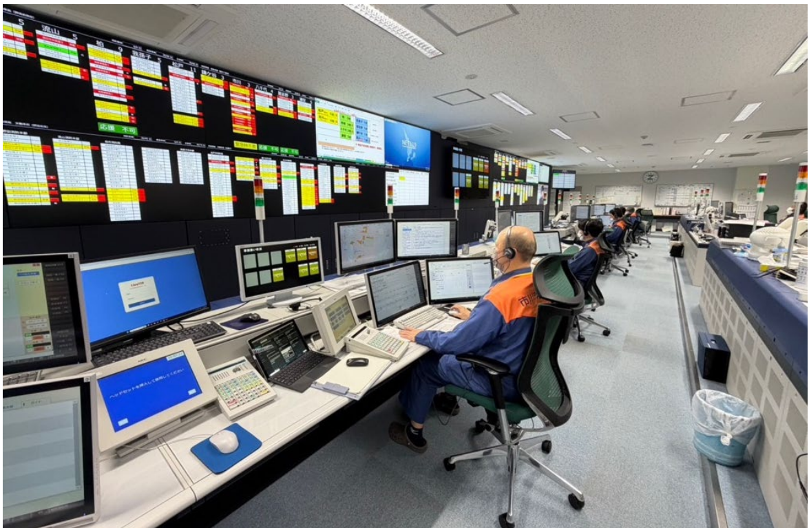
ちば北西部消防指令センター