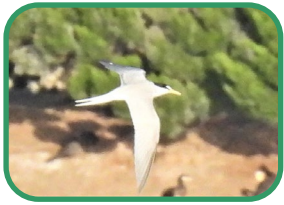
初夏の渡り鳥コアジサシ 繁殖場所が減っていてピンチ！な鳥。

5月ごろ、日本で子育てをするために、南から渡り鳥がやってきます。ツバメやコアジサシがその代表です。また北半球から南半球への長い旅の途中で干潟に立ち寄って羽を休めるシギ類も姿を見せます。毎日、どんな鳥が訪れるか楽しみな、ちょっとわくわくする季節です。