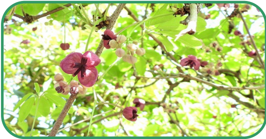
アケビ 木通 Akebia quinata

3月から4月、丸浜川河畔の雑木にからみついた蔓に、めしべのあるえんじ色で大きめの雌花と、薄いピンクの小さな雄花がセットで咲きます。秋には白い柔らかな果肉に黒い小さな種を無数に含んだ実をつけます。甘いもの好きの鳥たちの大好物、そしてタヌキたちにとってもごちそうです。蔓は編んで籠などに、新芽や果皮も山菜として利用されます。