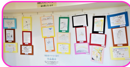
2階にある来館者の作品コーナー。掲示は3か月ぐらいです。

色鉛筆、水彩絵の具、クレヨンなどを貸出します。思い切り好きな絵を描いてみませんか？ 大人の方もぜひどうぞ。作品は持ち帰り、館内掲示どちらでもOKです。