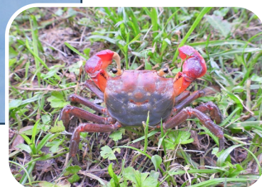
林の下草の中にあるアカテガニ