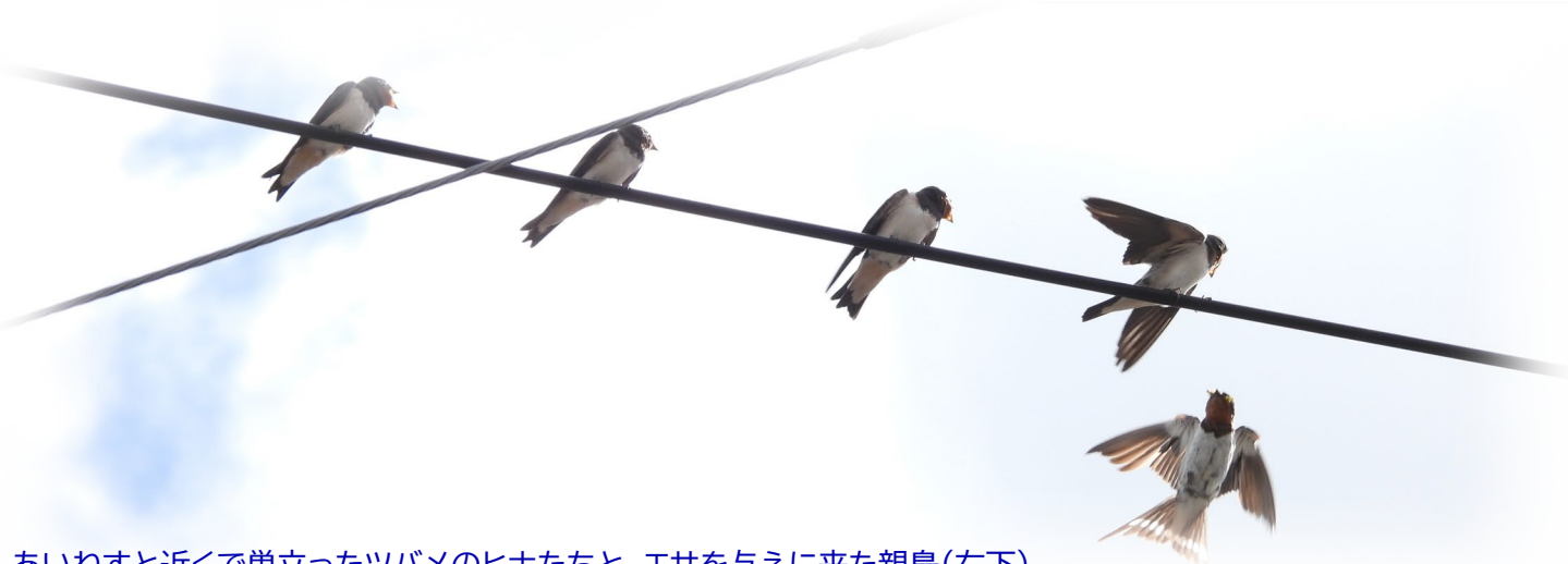
あいねすと近くで巣立ったツバメのヒナたちと、エサを与えに来た親鳥(右下)

発行者 市川市行徳野鳥観察舎あいねすと 2026年3月19日 第18号 〒272-0137 市川市福栄4-22-11 電話 047-702-8045(代表)