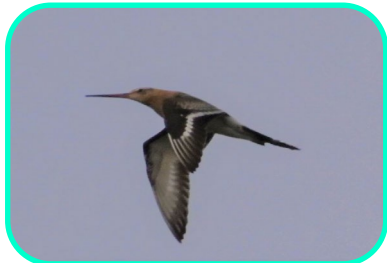
オグロシギ。なかなか会えない鳥。あいねすと上空を、さまざまな渡り鳥が飛んでいることを実感します。