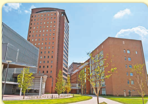
和洋女子大学コース