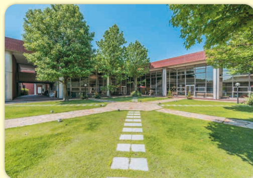
環太平洋大学コース