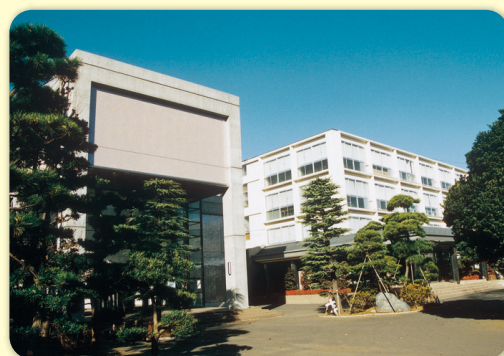
昭和学院短期大学コース