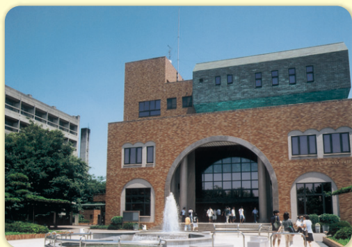
千葉商科大学コース